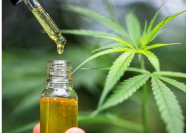
Figura 1: Óleo de cannabis CBD