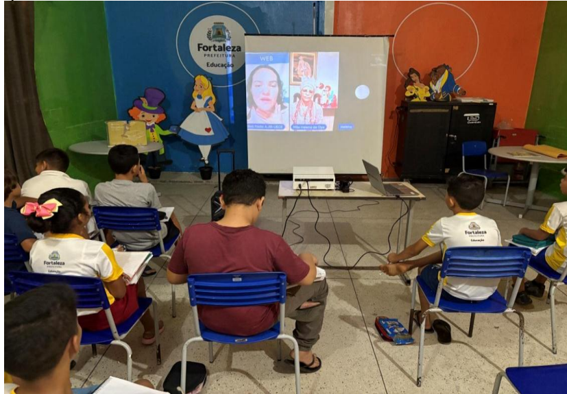
Figura 2. Foto dos alunos que participaram do programa “Em sintonia com a saúde: Racismo religioso: Diálogos com as juventudes” que ocorreu no dia 03/09/2025, na Escola José Batista de Oliveira. Fortaleza, Ceará, 2025.

Fonte: Elaborada pelos próprios autores.