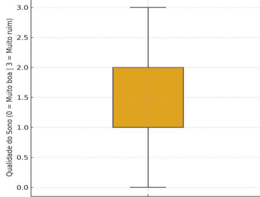
Gráfico 3 - Distribuição da Qualidade do Sono (autoavaliação geral)