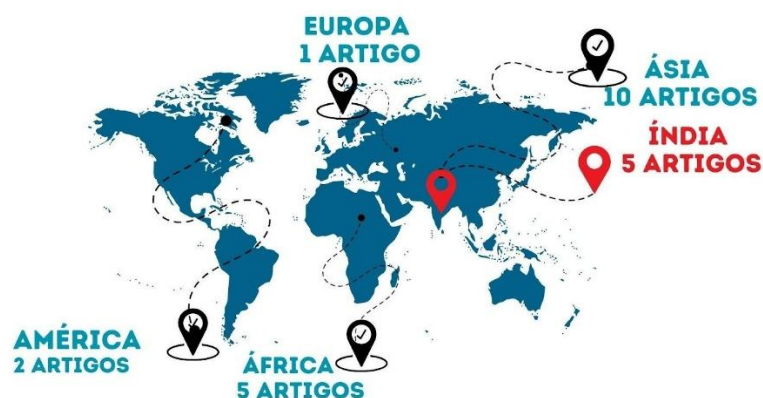
Figura 2 - Ilustração representando o número de artigos selecionados para revisão, classificados por continentes de publicação.

Pellenq; Lima; Gunn, 2022; Sahoo, 2021), seguido por cinco estudos na África (Adabor; Ayesu, 2024; Galdo; Dammert; Abebaw, 2021; Kechagia; Metaxas, 2020; Musizvingoza; Blagbrough; Pocock 2022; Sovacool, 2021), dois estudos na América (Custódio; Kern, 2022; Carrión-Yaguana; Meneses; Cruz Pazmiño, 2021) e um na Europa (Valls, 2020). Destaca-se a Índia como o país com mais estudos relacionados ao tema, totalizando cinco pesquisas (Ganguly; Goli; Sullivan, 2023; Jajoria; Jata; Mishra, 2024; Kim et al. 2023; Kim; Olsen, 2023; Sahoo, 2021), conforme ilustrado na figura 2.