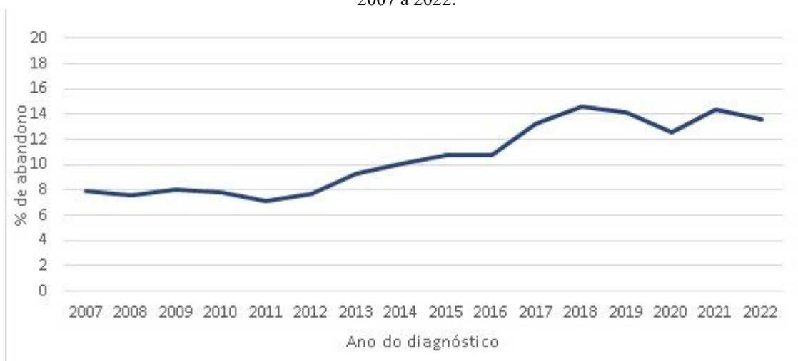
Figura 1 – Coeficiente de abandono do tratamento da hanseníase por ano de diagnóstico, no estado de Mato Grosso, de 2007 a 2022.

Fonte de dados: SINAN. Produzida pelos autores.