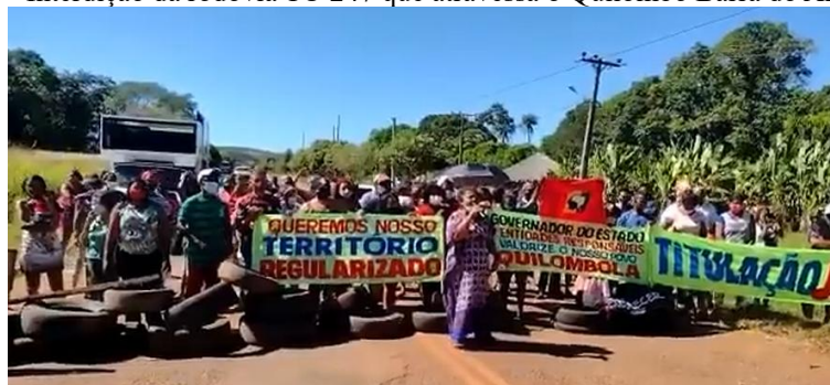
Figura 2 – Interdição da rodovia TO 247 que atravessa o Quilombo Barra do Aroeira, TO.

Atualmente, conforme Alves (2021), a comunidade quilombola da Barra da Aroeira mantém uma luta participativa e contínua pela regularização de seu território. Diante da ausência de avanços em suas demandas, seus membros têm mobilizado estratégias de resistência e fortalecimento da organização coletiva, com o objetivo de sensibilizar as autoridades para uma problemática histórica vivenciada há muitos anos. Um exemplo dessa mobilização é o ato de interdição da rodovia TO 247, refletindo o histórico de resistência das populações negras, especialmente em estados como o Tocantins, marcados pela expansão do agronegócio e a exploração das terras para a pecuária e a agricultura de soja, destacando-se como um exemplo de organização e resistência no cenário nacional.