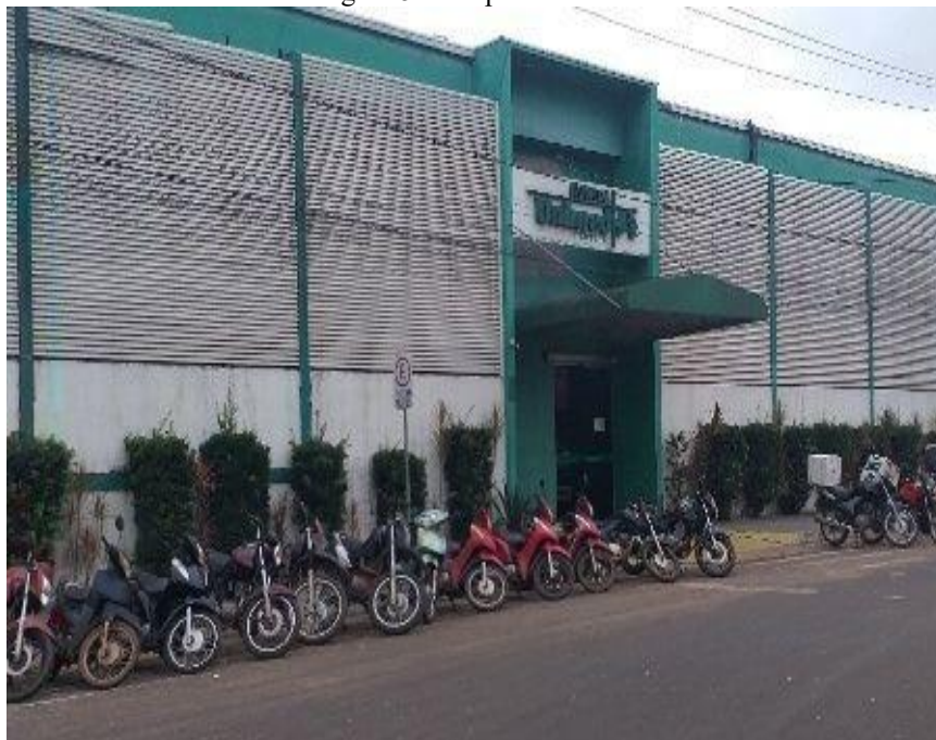
Figura 5 - Hospital Unimed

No caso do Hospital Unimed, apresentado na Figura 5 , observa-se uma inserção territorial marcada pela coexistência de usos residenciais, comerciais e de serviços. A presença de praça pública, residências, clínicas, consultórios, estabelecimentos comerciais e escritórios no entorno indica uma configuração urbana mais híbrida, na qual o hospital contribui para a diversificação funcional e para a gradual transformação do uso do solo, sem eliminar completamente as funções residenciais existentes.