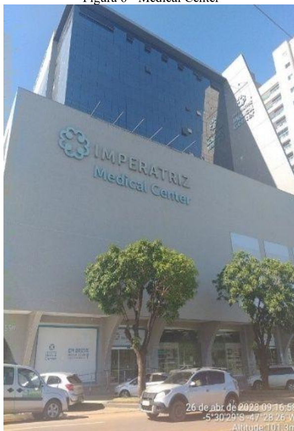
Figura 6 - Medical Center