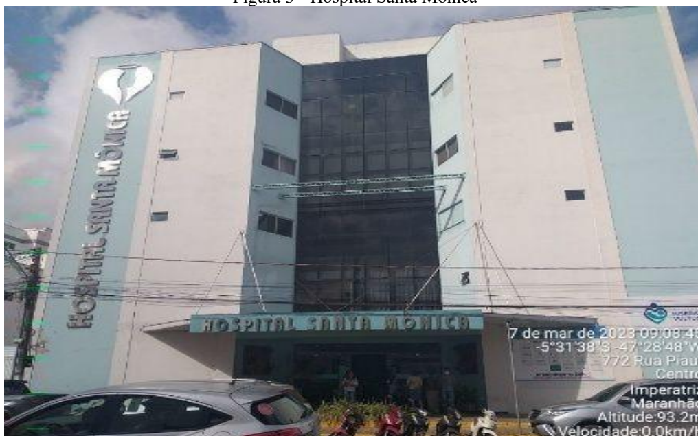
Figura 3 - Hospital Santa Monica