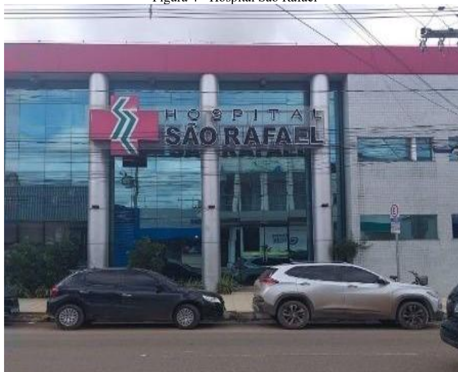
Figura 4 - Hospital São Rafael

O Hospital São Rafael, ilustrado na Figura 4 , localiza-se na Avenida Dorgival Pinheiro de Sousa, um dos principais eixos viários da cidade. A área apresenta intensa circulação de pessoas e veículos, além de grande diversidade de usos, incluindo laboratórios, postos de combustíveis, lojas comerciais, óticas, lanchonetes e clínicas especializadas. A inserção do hospital nesse eixo reforça a relação entre acessibilidade, visibilidade urbana e implantação de equipamentos hospitalares privados, além de evidenciar a integração desses empreendimentos a circuitos comerciais consolidados.