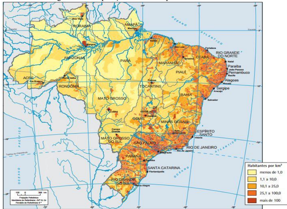
Figura 2 - Composição dos municípios no Brasil em 2016:

fonte de receita desses municípios provém dos repasses realizados pelos governos estadual e federal. Existe uma dependência desses municípios em relação a serviços fornecidos por outras localidades, as quais recebem uma quantia superior de recursos oriundos dos governos estaduais e da União. A administração municipal é a principal fonte de emprego para a mão de obra da região.