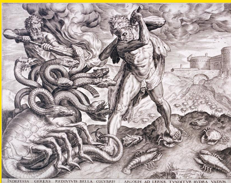
Hércules Matando a Hidra de Lerna, Cornelis Cort (1533–1578). A figura mitológica de um monstro com vários tentáculos ou cabeças que faz parte de um só organismo no imaginário popular é ancestral e remete, na sua forma atualizada, ao que chamam de “globalismo”.

centros de força, não raro se engalfinham em suas “guerras por procuração”, as chamadas Proxy Wars , que se tornaram, particularmente frequentes da Guerra Fria até os dias de hoje.